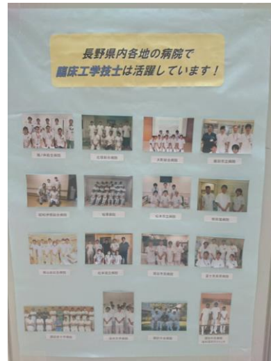
施設集合写真展示