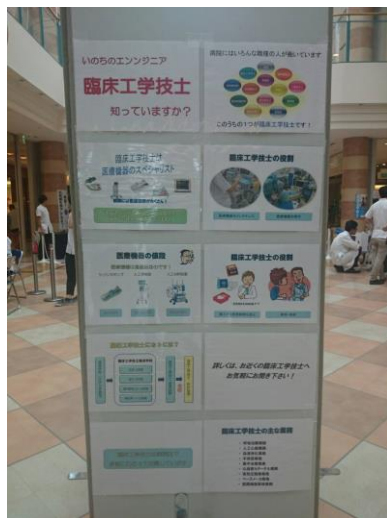
臨床工学技士って何？資料展示