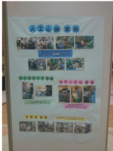
仕事風景写真展示