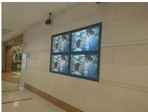
臨床工学技士 PR ムービー